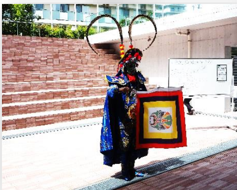
中国伝統芸能 変面